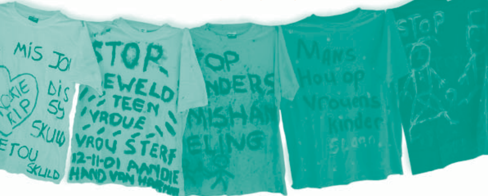
DEELNEMERS BY DIE KONFERENSIE